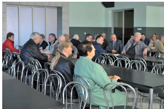
Janowice - mieszkańcy obecni na zebraniu

Podobnie jak na trzech poprzednich zebraniach wójt przedstawił mieszkańcom plan budowy kanalizacji Janowic i południowej części Bestwiny. Całość projektu powinna zamknąć się w 70 – 80 mln zł, będzie to zatem największa inwestycja w gminie Bestwina. W Janowicach nie zabrakło również informacji o wymianie pieców, pokryć azbestowych i zmianie planu zagospodarowania przestrzennego. Ruszyły także długo oczekiwane przetargi na długo oczekiwaną budowę drogi ekspresowej S1, jakkolwiek w czasie trwania zebrania nie był jeszcze znany termin przetargu na odcinek mający przechodzić przez gmi-