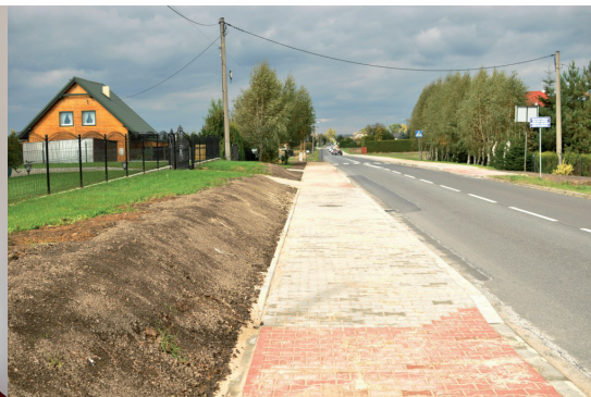
Chodnik na ul. Witosa