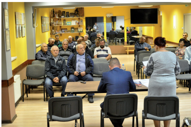
Bestwina - zebranie w sali widowiskowej GOK

W kwestii postulatu budowy zatoczki autobusowej powyżej piekarni wójt poinformował, że przetarg na to zadanie wygrała p. Żukowski z Pisarzowic. Na poprzednim zebraniu zaangażowano również o zwrócenie uwagi na zaśmiecanie terenu przy sklepikach w centrum. To znany problem, regularnie pojawiają się tam pracownicy, ale wiele zależy od postawy