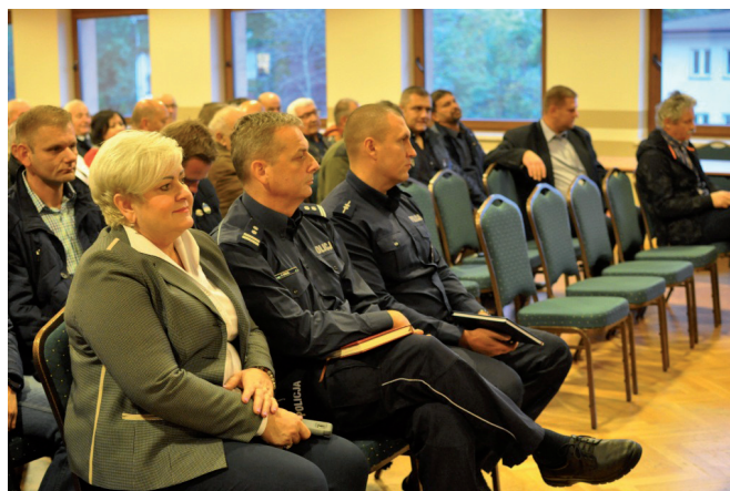
Kaniów - goście zebrania i mieszkańcy

Kilka tematów dodał sam wójt. Zaznaczył, że przy pomocy Starostwa Powiatowego została wyremontowana ul. Dankowicka łącznie z chodnikiem i asfaltem, razem – 3 mln. zł. Przy tejże ulicy wykonano podwyższone przejście dla pieszych, a przy ul. Mirowskiej zainstalowano dwa lustra. Rozpoczęła się budowa boiska wielofunkcyjnego przy terenach rekreacyjnych w Kaniowie (dofinansowanie w okolicach 120 tys. zł. z PGS, 80 tys. to wkład własny). Został wykonany projekt i uzyskano pozwolenie na budowę żłobka (właściwie: klubu dziecięcego), zadanie realizowane z programu „Maluch+”. Być może, przy optymalnych warunkach, inwestycja ruszy w przyszłym roku.